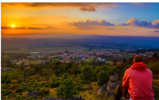
2.º Premio — “Um ocaso do sol em Gouveia”.